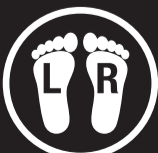
LEFT & RIGHT DESIGN

Produced, idealized & Distributed by Revenge Srl