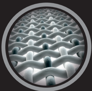
SILVER YARN ANTIBACTERIAL