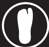
ONE FINGER STRUCTURE